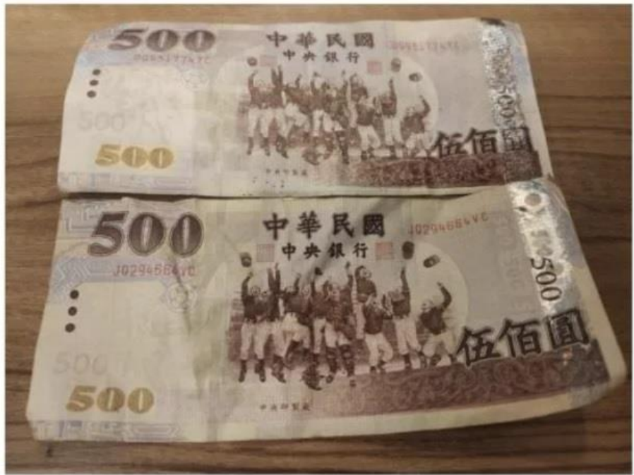
▲網友分享自己收到500元假鈔，其對比圖揪出三大不同點。

一名網友在「Dcard」貼文指出「前幾天上班的時候收到假鈔，金額是$500元，照理說是收銀人員要自己負責，但人家一天工作也才賺一千塊，直接白費工作半天，後來決定和和大姊一人付擔一半，降低她的心碎感」。