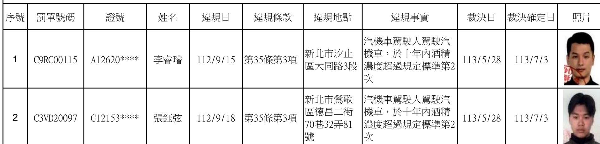
113. 10. 23 新北市酒(毒)駕及拒測累犯公告名單