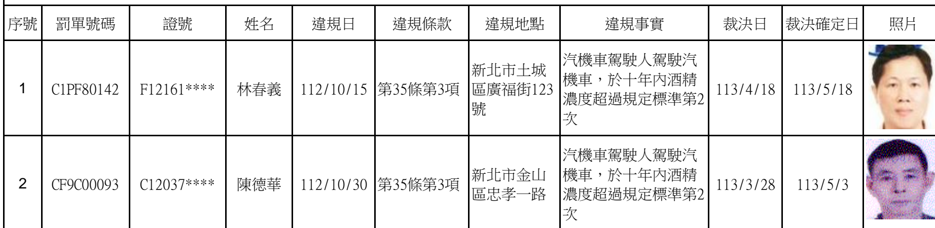
113. 8. 15 新北市酒(毒)駕及拒測累犯公告名單