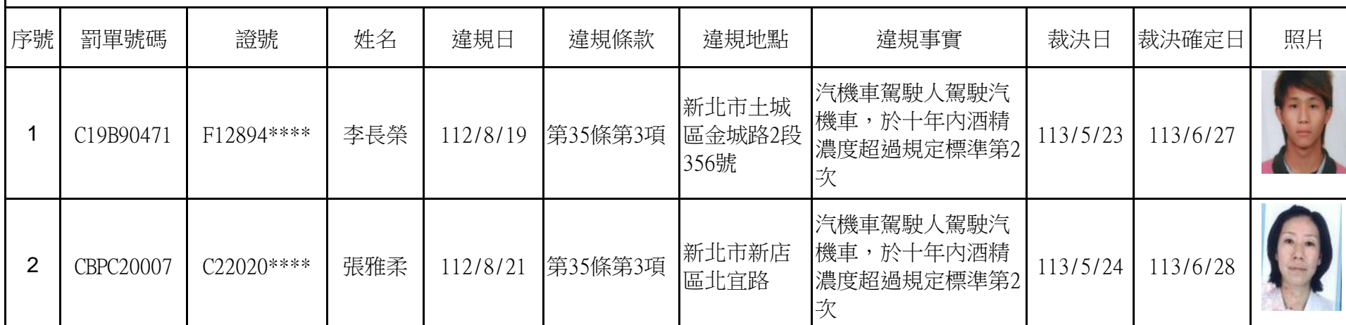
113. 9. 26新北市酒(毒)駕及拒測累犯公告名單